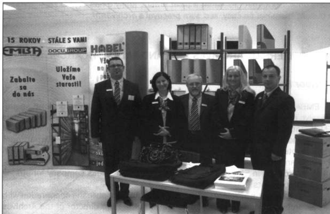
Autor príspevku (v strede) so spolupracovníkmi na XIV. archívnych dňoch v SR v Komárne

z toho množstva tých dokumentov, ktoré majú historickú hodnotu, je naše poslanie. Aj za toto poznanie ďakujeme archivárom .